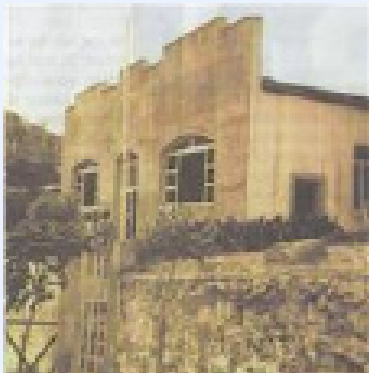
Salão do Horto

COMO EM JERUSALÉM, HÁ QUASE DOIS ANOS, O ESPÍRITO SANTO ACENDE EM VITÓRIA UMA CHAMA DA UNIDADE DA IGREJA