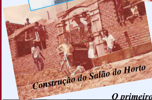
Construção do Salão do Horto